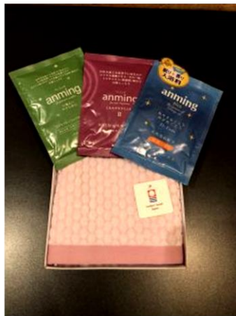
※詳細は添付資料にて

睡眠の研修医監修のもと作られたバスエッセンスです。天然オイル配合で、心身の緊張をほぐし快適な眠りを誘います。タオルの色指定はできませんが、今治製の柔らかい手触りですよ。